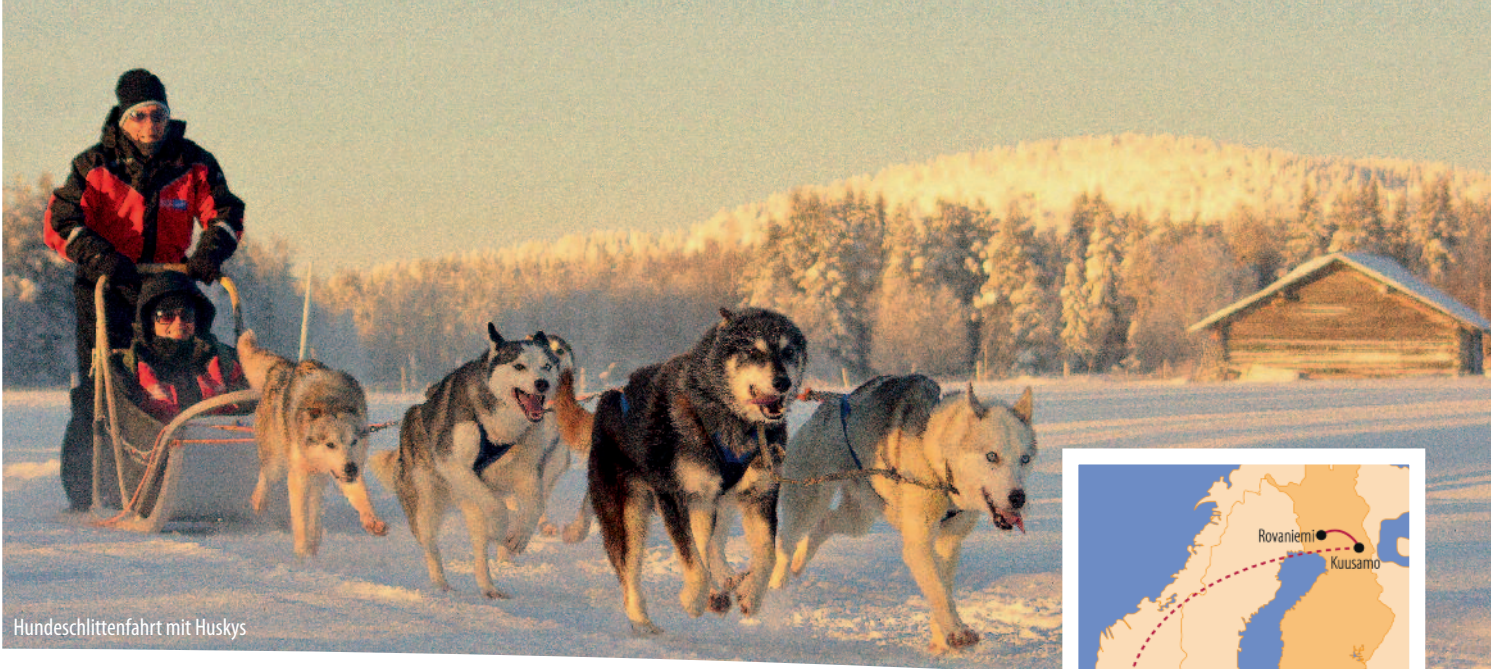
Hundeschlittenfahrt mit Huskys